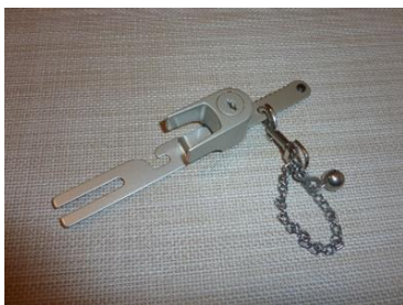
図. クレセント錠の補強金具*

2枚の引き違い戸に使われている一般的なクレセント錠は、ガラスを割って外から開けることができます。窓から侵入されて合鍵を取られてしまうと、性能が高い鍵でも効果は期待できません。そこで、左下の写真のようなクレセント錠の作動を直接ロックする補強金具を取り付けることもできます。