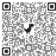
【申込用 QR コード】